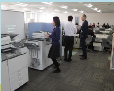
マグネットスペース