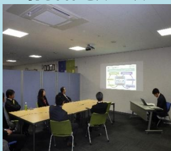
打ち合わせスペース

ViCreA（ヴィクレア）は、私達のワークスタイル変革へのチャレンジをご体感頂く空間「LiveOffice」です。社内実践事例のご紹介を通して、お客様の価値創造へのお役立ちをさせていただきます。